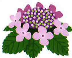
アジサイの 苗木等販売