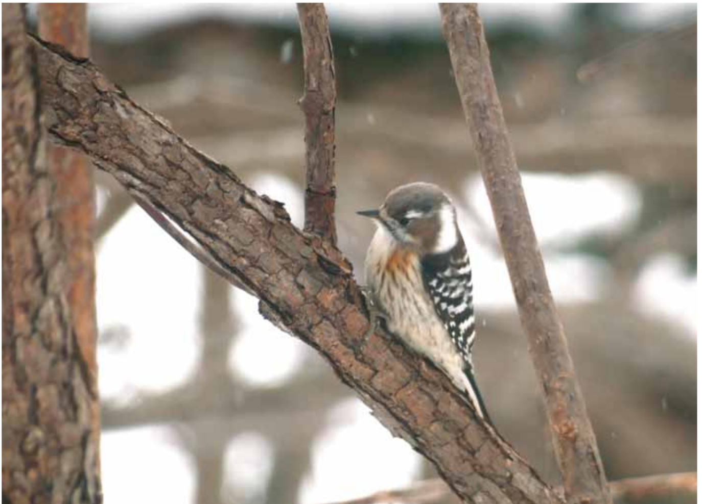
函館山緑地～コゲラ～ 冬の函館山は木々の葉が落ち、 野鳥観察がしやすいですよ。