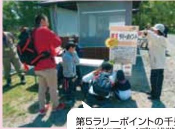
第5ラリーポイントの千畳敷広場にてクイズに挑戦している参加者。