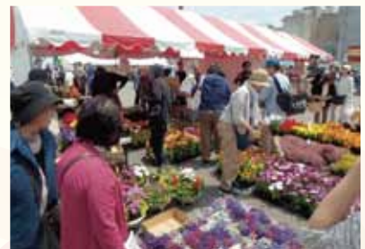
多種多様な植物を肌で感じふれあうことで、心の豊かさやゆとりを実感できる機会を提供しています。

皆さまからご協力いただいた「花と緑のパートナーシップ募金」を一部の緑化普及事業に活用しています。