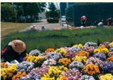
市民ボランティアとの協働で花壇管理をしています。