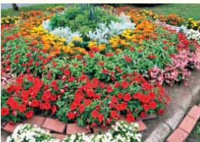
次世代を担う子どもたちへ、緑化の継承や心を豊かにする情操教育の機会を支援しています。