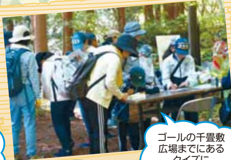
ゴールの千畳敷広場までにあるクイズにチャレンジ!!