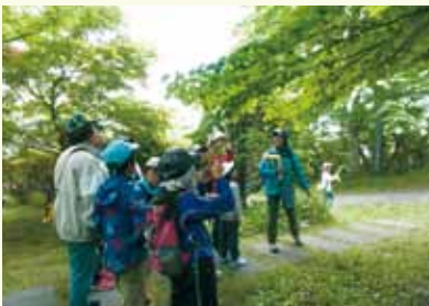
函館山ふれあいセンターボランティア活動推進事業

市内の大規模公園(函館山緑地、函館公園、昭和公園、五稜郭公園、市民の森、見晴公園)の特色を活かした公園活用講座を開催しています。また、園内のガイドや維持管理などをボランティアと協働で行っています。