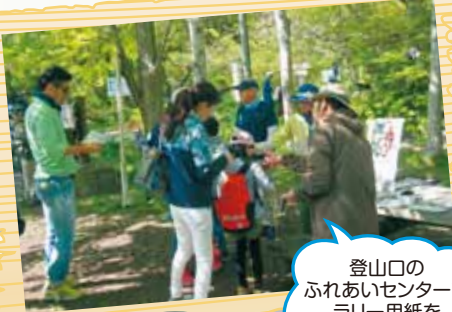
登山口のふれあいセンターでラリー用紙を受け取ったら...