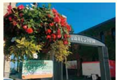
趣旨に賛同する企業からの協力で花壇等を設置し管理しています。