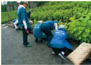
市民の森アジサポート隊活用事業