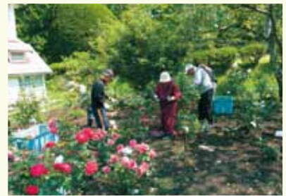
見晴公園ボランティア活動推進事業