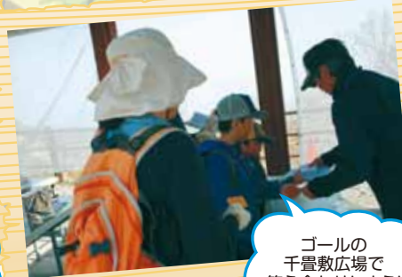
ゴールの千畳敷広場で答え合わせしよう!