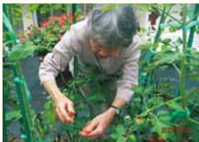
癒し・リラックス・機能回復など、園芸療法的効果への取組みに支援・協力しています。