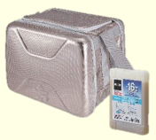
LOGOS ハイパー氷点下 クーラーXL 3名様

※諸事情により、賞品の内容を変更させていただくことがありますのでご了承ください。 ※Nintendo Switchのロゴ・Nintendo Switchは任天堂の商標です。