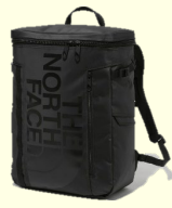
THE NORTH FACE BCヒュースボックス2 3名様