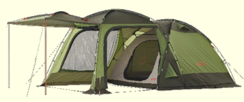
LOGOS neos PANEL スクリーンドゥーブル XL-BJ 1名様

全8個のスタンプを集めて抽選に チャレンジ!! 豪華賞品をゲットしよう! 賞品の形態や仕様など、掲載写真と異なる場合があります(写真はイメージです)