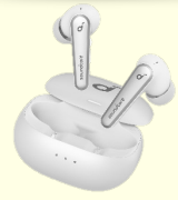
アンカー・ジャパン Anker Soundcore Liberty Air 2 Pro ホワイト 3名様