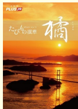
JTBえらべるギフト 「たびもの撰華」 橋コース(5万円相当) 1名様