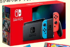
© Nintendo Nintendo Switch Nintendo Switch Sports リングフィット アドベンチャー 3点セット 1名様