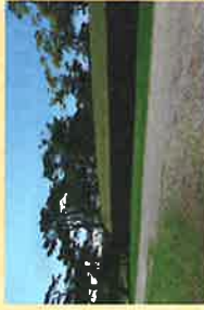
6 石垣 いはかき

堀の外側に広がる斜面。堀から外へ逃げ出すための土塁。門から出てくる人馬が直接見えないようにするための土塁。