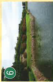
8 石垣 いはかき

城塞から孤立した菱形の土塁。門から出てくる人馬が直接見えないよう内部を守るための工夫。