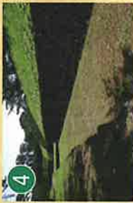
4 空堀 からほり

稜堡と呼ばれる5つの突角を配し、星形五角形を呈する外観から五稜郭と呼ばれています。元治元年(1864年)に完成した五稜郭は、箱館戦争の後、役所としての機能を失い、明治30年まで明治政府陸軍省の所管となりました。大正3年からは「五稜郭公園」として一般開放され、昭和27年には「五稜郭跡」の名称で特別史跡として国の指定を受け、以後国民的遺産として保護・保存の措置が図られています。