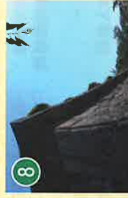
9 石垣 いはかき