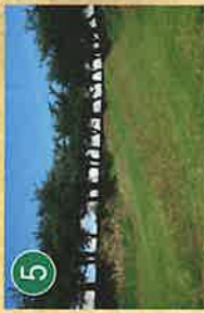
5 長斜堤 ちようしゃいでい

郭内に水が入っていない堀がいまも残っています。石垣が壊されたときに石が崩れて水を塞がないようにつくられたもの。