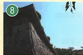
刎ね出し石垣 はねだしいしがき (武者返し むしやがえし)

城塞から独立した菱形の土壘。門から出てくる人馬が直接見えないよう内部を守るための工夫。