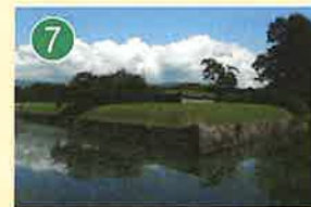
半月堡 はんげつほ

城塞から独立した菱形の土壘。門から出てくる人馬が直接見えないよう内部を守るための工夫。