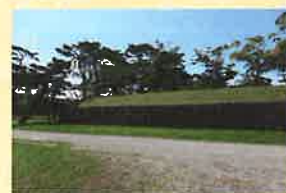
見隠し壘 みかくしるい (目隠し壘 めかくしるい)