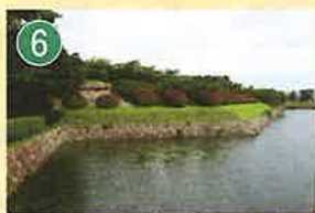
長斜堤 ちょうしゃてい